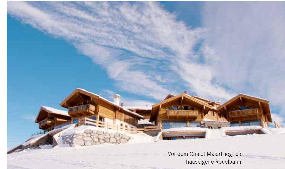
Vor dem Chalet Maierl liegt die hauseigene Rodelbahn.